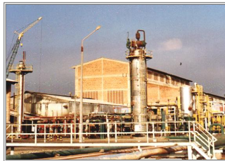
Figura 2. Detalle de la sección de síntesis Planta de Amoniaco

La inversión necesaria para normalizar las operaciones en la Planta de Amoniaco están fundamentadas en los informes técnicos de las Direcciones de Ingeniería de Plantas, Mantenimiento, Laboratorio Industrial, Record de Operación y vida útil de los equipos, Consumo de materias primas, Análisis de problemas operacionales y Estadística de producción por plantas, además de los estudios de integridad de equipos realizados por firmas especializadas, en los cuales se evidencia el deterioro del estado mecánico y operacional de algunos equipos fundamentales para la operación de la planta de amoniaco, y los cuales están generando inconvenientes operacionales.